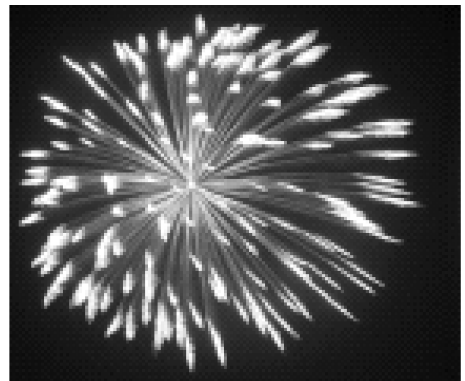
(a) 单个烟花爆炸产生火花

点燃的烟花被发射到夜空中,爆炸产生火花继而照亮其临近的夜空,产生出一幅美丽的图案。事实上,一个优化问题的求解过程亦是如此。对于一个最优化问题,尤其自变量是连续空间的最优化问题,在整个解空间内,如何有效迅速地找到全局最优解呢?在烟花算法中,烟花被看作为最优化问题的解空间中一个可行解,那么烟花爆炸产生一定数量火花的过程即为其搜索邻域的过程,如图 1 所示。